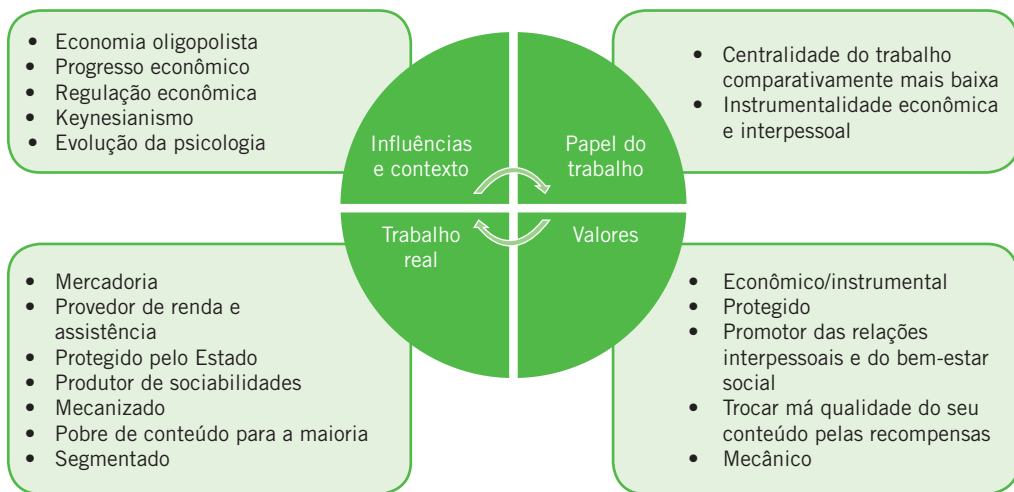
Figura 1.2 Uma síntese da concepção do trabalho sob o estado do bem-estar.

equipes polivalentes mostrou-se mais produtiva. Os riscos dos capitalistas eram poucos, dado que as jazidas de carvão eram raras, de modo que os mineiros não podiam produzir por conta própria (Marglin, 1980).