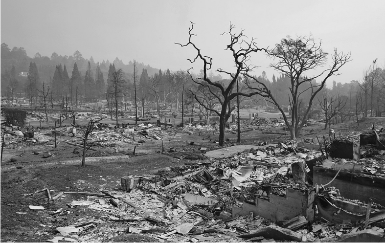
Figura 1. Mudança climática. Há um claro consenso científico a respeito da influência dos seres humanos na mudança climática, incluindo sua relevância para alguns eventos climáticos contemporâneos (como os incêndios de 2017 na Califórnia desta imagem). Contudo, isso não impediu que algumas notórias figuras políticas negassem o consenso científico.

testemunhos incríveis, mas somente que devemos sempre exigir fundamentos extras nesses casos (por exemplo, podemos querer ver as notícias para verificar esse espantoso relato).